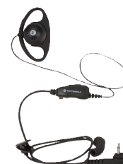
Słuchawka typu D z mikrofonem i przyciskiem PTT na przewodzie

Radiotelefony serii XT600d są kompatybilne z akcesoriami serii XT400 z wyjątkiem uchwytu do noszenia i futerału skózanego.