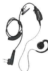
Słuchawka nauszna z mikrofonem i przyciskiem PTT na przewodzie