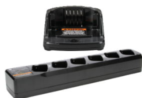
Ładowarki jedno- i wielostanowiskowe