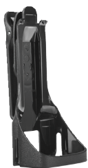
Uchwyt do noszenia