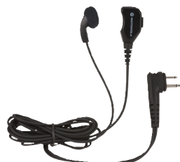
Słuchawka douszna z mikrofonem i przyciskiem PTT na przewodzie